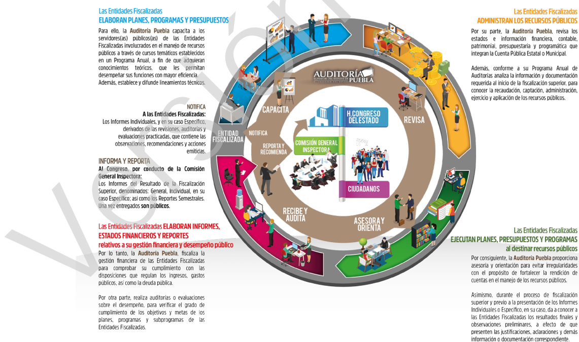
Diagrama 1 Proceso de Fiscalización Superior 2017